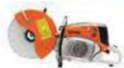
C | SCIE À BÉTON 14" À ESSENCE