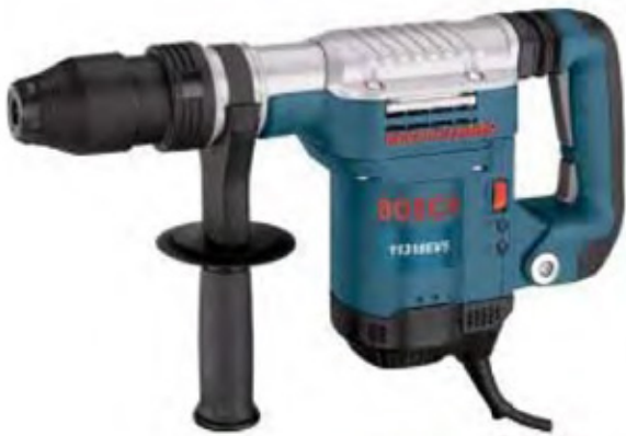
A | MARTEAU CASSEUR 11 LB